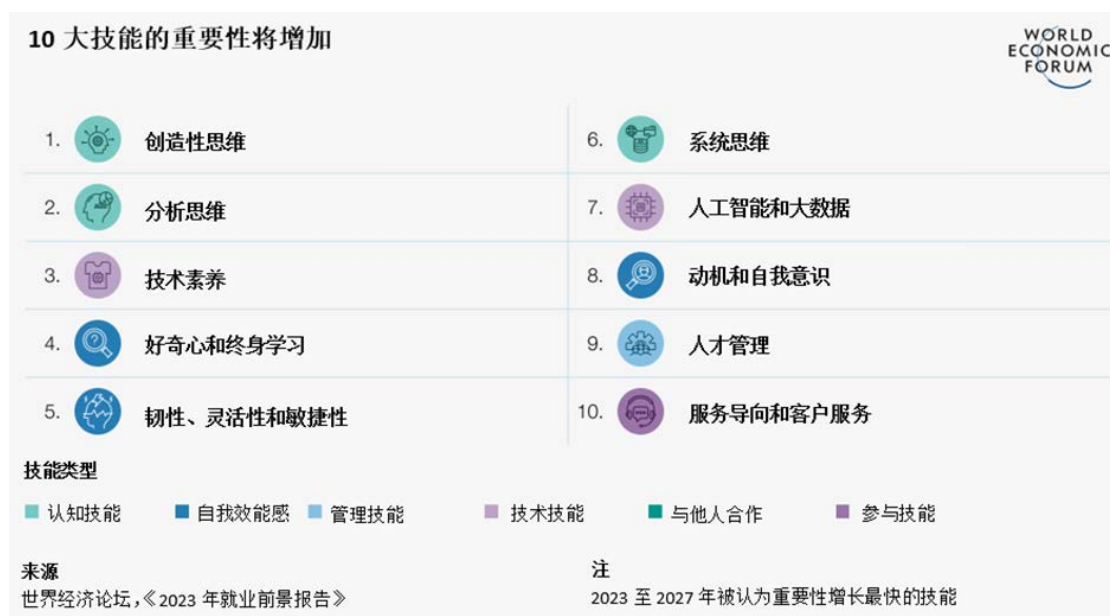
图2：日益重要的十大技能

资料来源：世界经济论坛，《2023年就业前景报告》数据基于对全球800家最大雇主的调查。