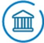
图4：利益攸关方在数字化转型中心（DTC）举措中的作用

政府： 向本国的 DTC 提供支持，并确保 DTC 的工作与国家数字战略、计划和优先事项保持一致。